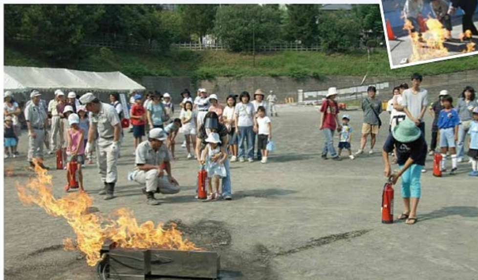
市民の自主防災訓練